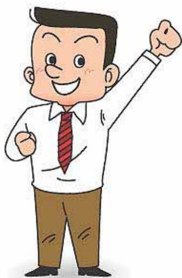
やる気满满社長さん

夢を実現するため いつもやる気满满!! でも、借入れのことが 分からなくて心配…。