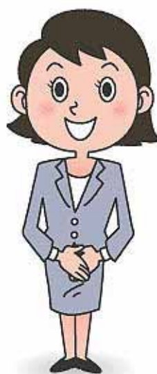
まごころ保証スタッフ